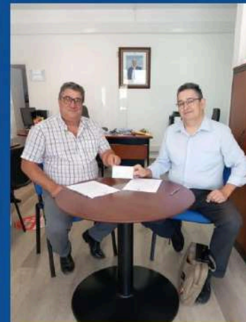
CBTTAA - Clube de BTT Amigos de Albufeira