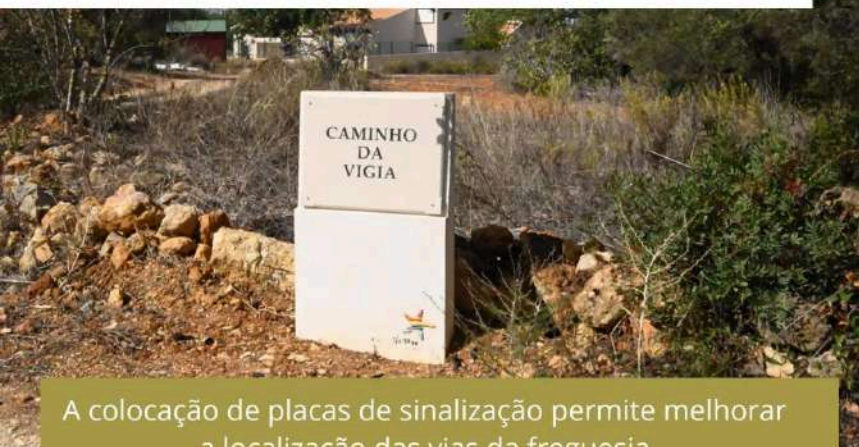
A colocação de placas de sinalização permite melhorar a localização das vias da freguesia