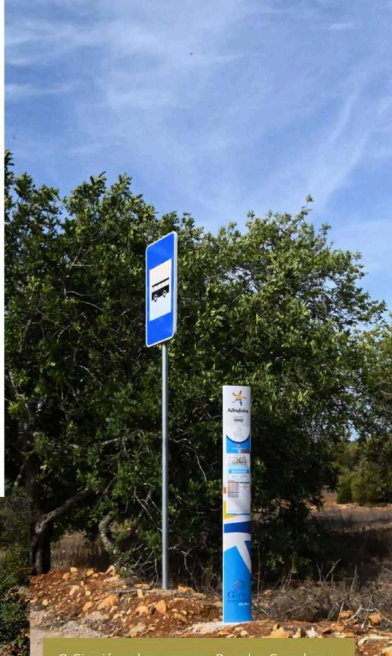
O Giro já pode passar na Rua dos Caçadores

Eis algumas das intervenções realizadas recentemente: