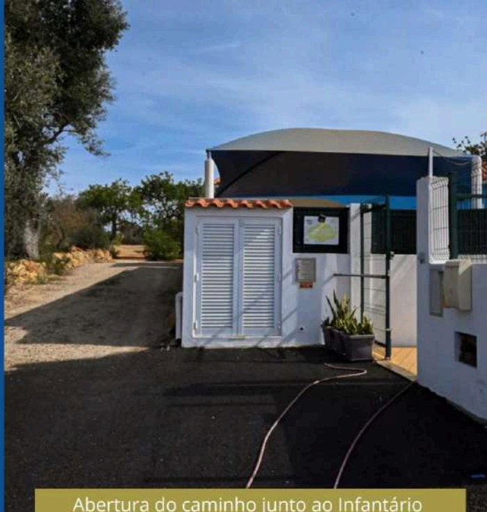
Abertura do caminho junto ao Infantário 'Turma dos Traquinas'