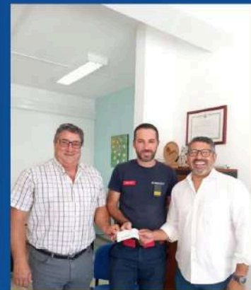
Associação Humanitária dos Bombeiros Voluntários de Albufeira