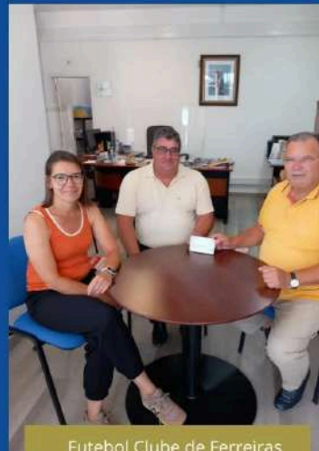
Futebol Clube de Ferreiras