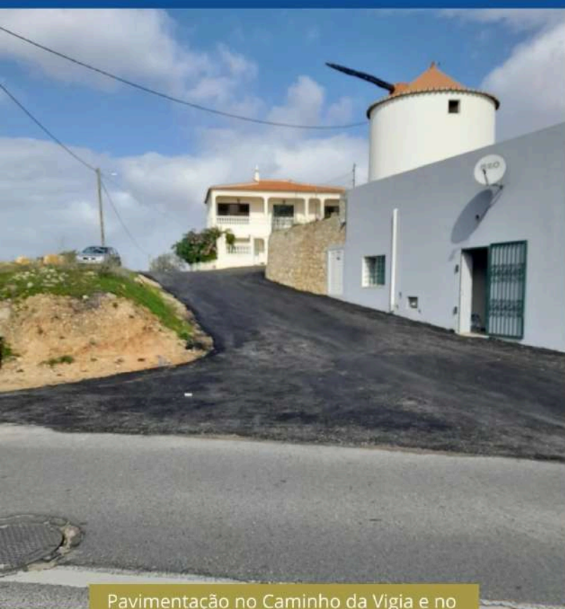
Pavimentação no Caminho da Vigia e no Beco da Vigia