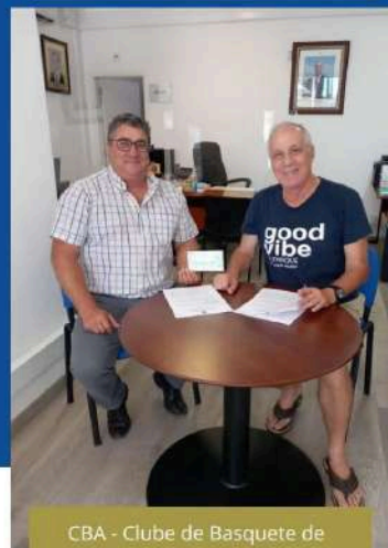
CBA - Clube de Basquete de Albufeira