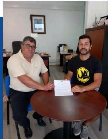
Juv'Albuhera - Associação Juvenil de Albufeira