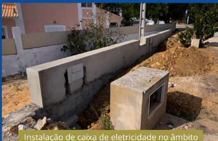
Instalação de caixa de eletricidade no âmbito do alargamento da Rua dos Caçadores