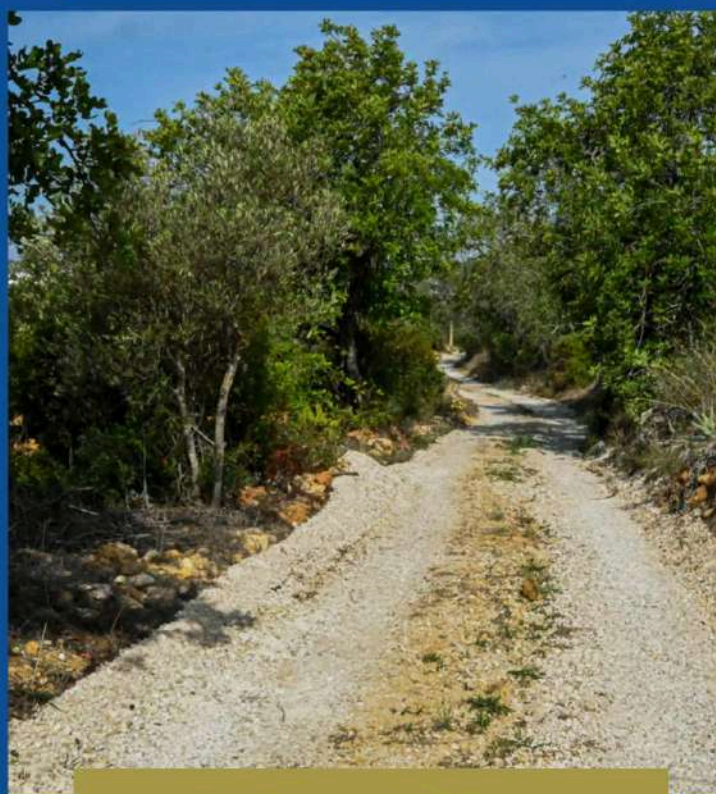
Arranjo do Caminho das Telhas Antigas