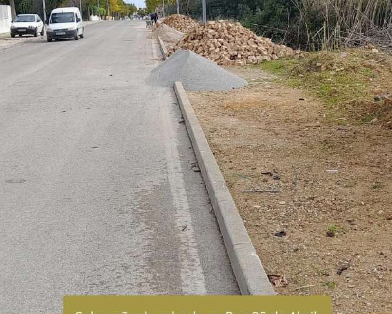
Colocação de calçada na Rua 25 de Abril